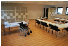
100 m 2 Seminarraum